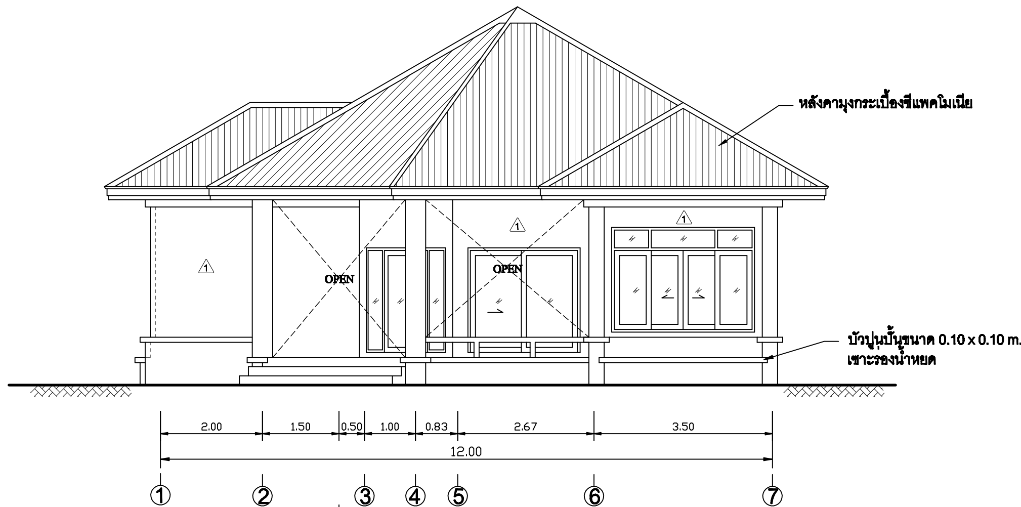
รูปด้าน 1 SCALE 1:75